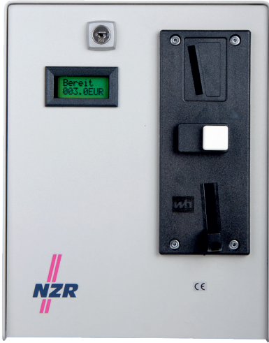
Abb. enthält eingebaute Option O