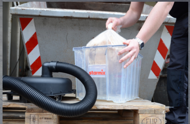
...oder mit Entsorgungsbeutel