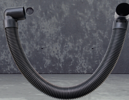
Verbindungsschlauch mit Winkelmuffe