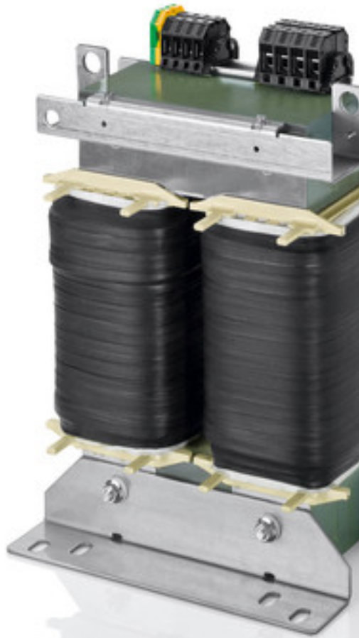
Abbildung zeigt TT1 20-4/23