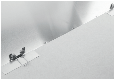
GK-Montage mit SNAP-IN Federeinbausatz