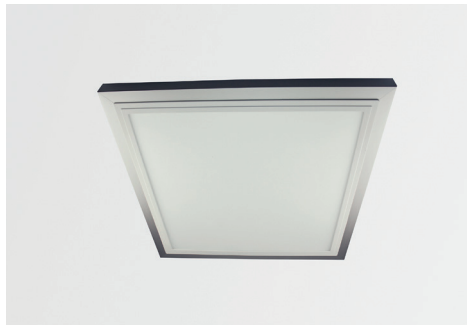
Aufbau-Montagerahmen für LED Panel SNAP, silber matt