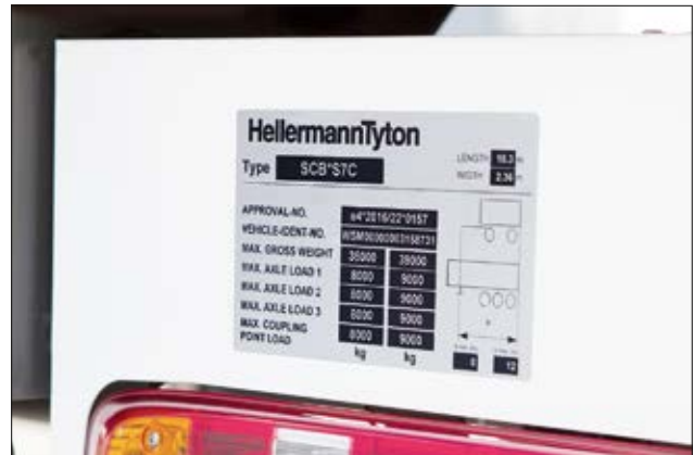
Typenschild eines LKW-Aufliegers mit Helatag Schutzlaminat.